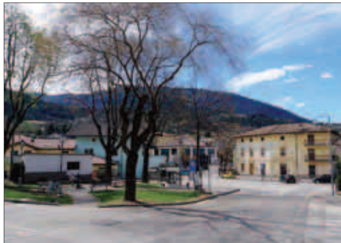
L'intervento partirà entro giugno e il termine previsto è a fine anno

rizzazione dell'antica fontana: situata ai limiti dell'attuale zona verde, diverrà adiacente ad uno dei tre percorsi di accesso al parco dopo essere stata liberata dai due muri in calcestruzzo che oggi ne offuscavano parzialmente la vista. Addio anche al manufatto - ormai in disuso - adibito a deposito attrezzatura degli stradini che, in origine, era sede di svolgimento del lavoro delle lavandaie presso la roggia che attraversa la piazza. «Se in sostituzione della vecchia lavanderia - afferma Cappelletti - saranno posati alcuni blocchi in marmo verdello, la memoria del passaggio sotterraneo della roggia sarà conservata attraverso la creazione di riquadri pavimentati con acciottolato di fiume, in raccordo con i sopra citati blocchi».